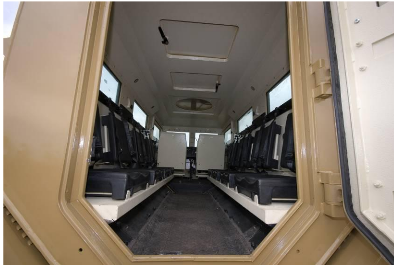
Figure 1: 10 Seater APC